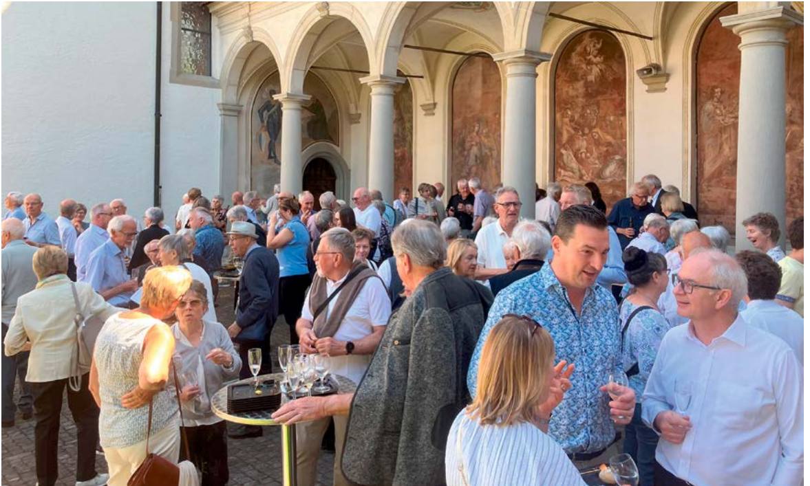
Apéro beim Pfingstgottesdienst.

Anmeldung bis 10. August unter 078 441 23 29 oder klara.porsch@pastoralraum.ch