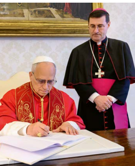
Papst Leo XIV. unterzeichnet die Enzyklika «Magnifica humanitas – über die Bewahrung des Menschen im Zeitalter der künstlichen Intelligenz».

Für Leo ist Wahrheit ein Gemeingut des demokratischen Lebens. Das heisst: Wer die Wahrheit untergräbt – mit Fake News, Deep Fakes oder polarisierenden Narrativen –, der untergräbt auch die Demokratie. Ausserdem kann es Wahrheit für Leo nur geben, wo Verantwortung und Vertrauen bestehen. Das heisst, Wahrheit muss verhandelt werden. Sie ist kein fertiges Gebäude aus dogmatischen Grundsätzen, die wir einfach umsetzen oder verkündigen sollen. Es ist bemerkenswert, dass ein Papst das so schreibt.