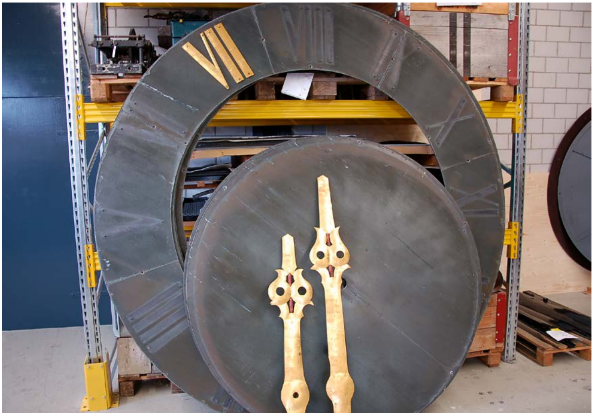
Abmontiertes Zifferblatt der Pfarrkirche Wolhusen bei der Aussenrenovation 2013.