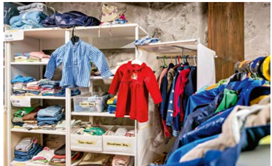
Der «Offene Kleiderschrank» befindet sich in einem Raum des Murihofs im Surseer Kirchenbezirk.

Kleider und Schuhe, Taschen, allerlei Accessoires, Schulrucksäcke oder Bettwäsche: Die Auswahl ist breit. Im grossen Raum im Murihof im Surseer Kirchenbezirk gehen Menschen ein und aus, die ihr Geld gut einteilen müssen: Armutsbetroffene aus Sursee und Umgebung. Im «Offenen Kleiderschrank» können sie sich kostenlos bedienen. Diese Möglichkeit nutzten letztes Jahr um die 100 Familien, 400 bis 500 Personen insgesamt. Letztes Jahr war der Kleiderschrank an 54 Halbtagen offen. Freiwillige – zurzeit elf – prüfen und sortieren, was Monat für Monat angeliefert wird: 40 bis 50 Säcke.